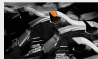
Possibilité de choisir entre différents types d'outils