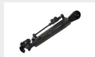
Attelage 3 points réglable