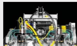
Le système Water Spray System sert à la fois à refroidir et à mélanger