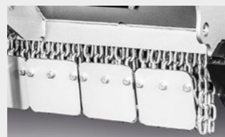
Plaques boulonnées pour chaînes de protection